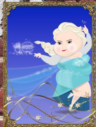
Elsa een maatje breder was ?