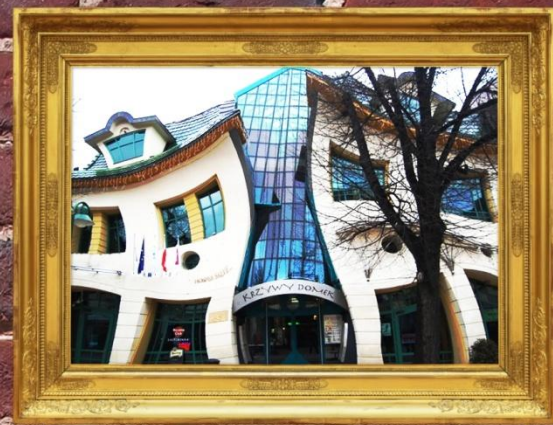
huizen konden smelten ?