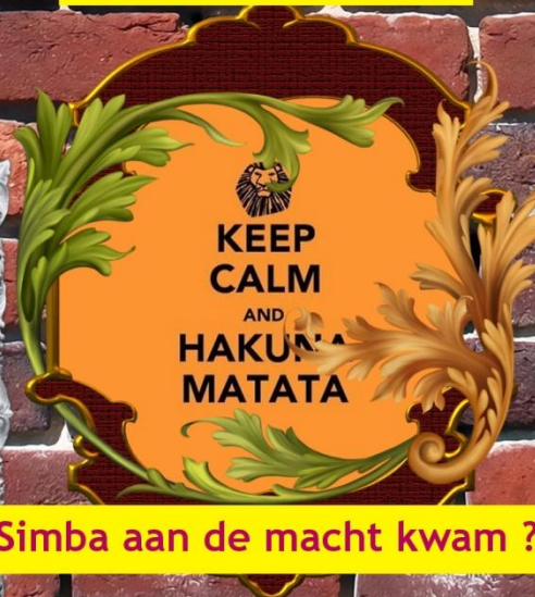
Simba aan de macht kwam ?