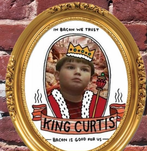
spek echt gezond was ?