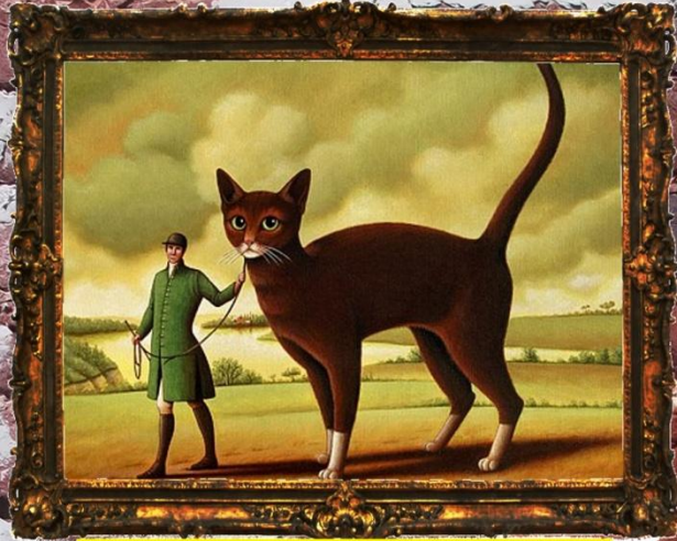
katten gigantisch waren ?