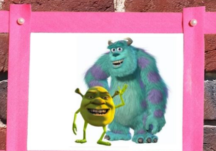
Shrek meespeelde in Monsters inc. ?