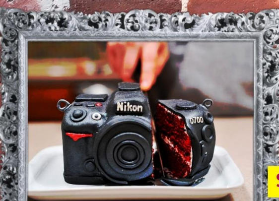
elektronica eetbaar was ?