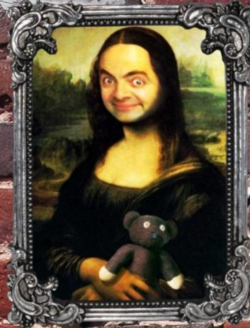
Mona Lisa eigenlijk Mister Bean was ?