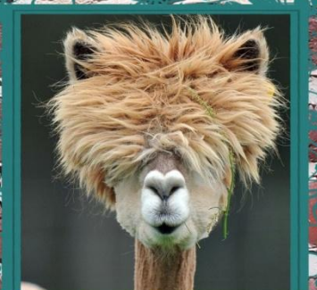
lama's naar de kapper gingen ?