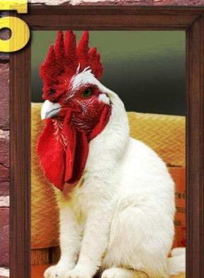
de konhaan bestond